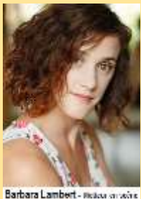
Barbara Lambert - photo d'archive

En 2018, elles changent de nom et s'appellent désormais « Les JumeLLes ».